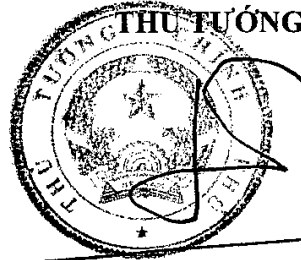
Nguyễn Tấn Dũng

Ủy ban nhân dân các tỉnh, thành phố trực thuộc Trung ương chịu trách nhiệm chỉ đạo Ủy ban nhân dân các cấp thuộc địa phương, tổ chức quản lý hoạt động kinh doanh cây cảnh, cây bóng mát, cây cổ thụ theo đúng quy định của pháp luật; tổ chức thực hiện cơ chế phối hợp liên ngành trong quản lý, điều hành hoạt động thực hiện Quy chế này./.